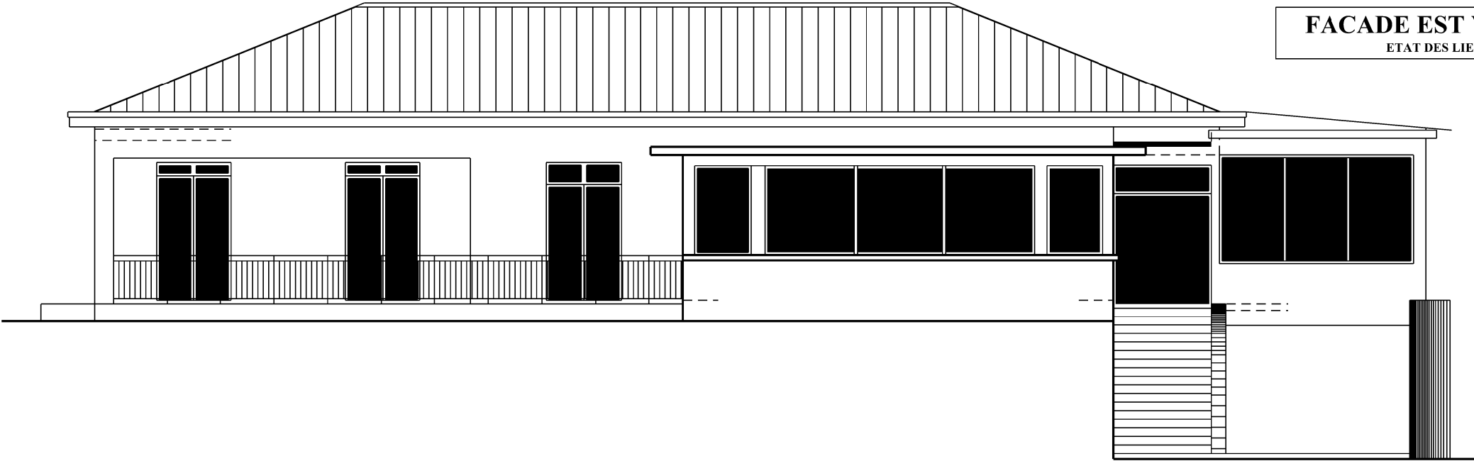
FACADE EST VILLA 2 ETAT DES LIEUX